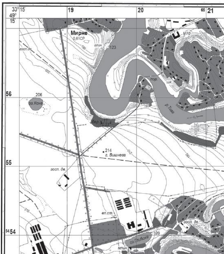
Масштаб 1 : 20 000 Суцільні горизонталі проведено через 5 м

Задання 13-14 відкритої форми з короткою відповіддю. Здійсніть розрахунки та визначте правильну відповідь (по 2 бали за кожне правильно виконане завдання).